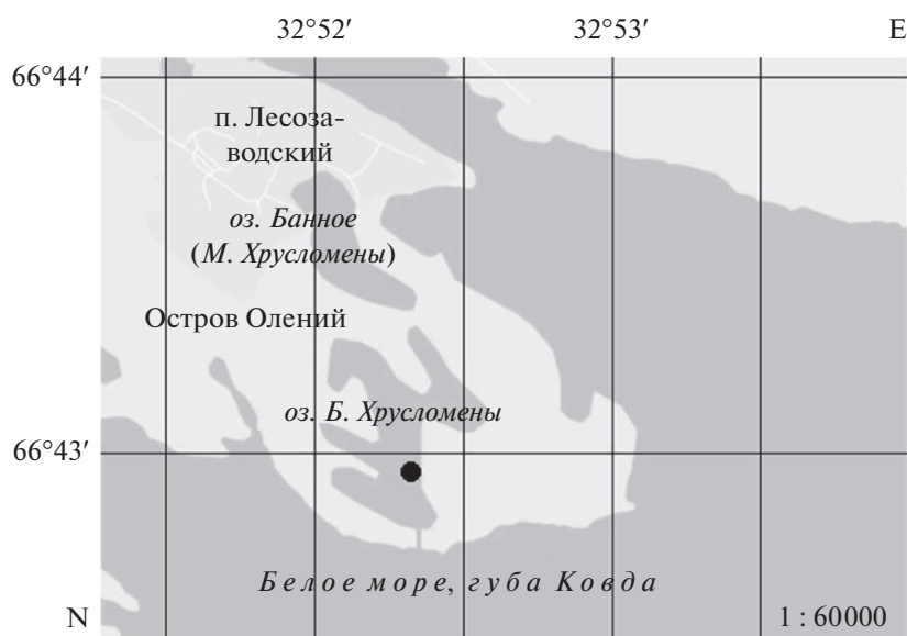
Рис. 1. Схема расположения озера Большие Хрусломены.