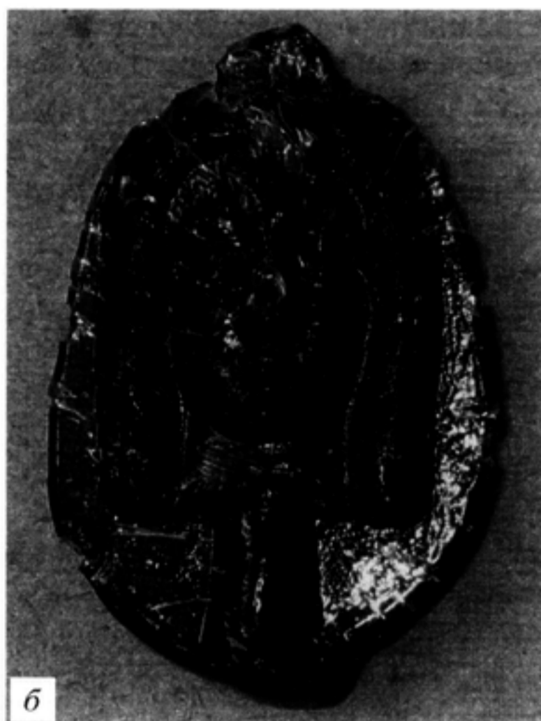
Рис. 1. Подвеска с городища Чайка: а – изображение Птолемея II Филадельфа; б – изображение обожествленной Арсиной II Филадельфы

иконографией монет 15 , ойнохой 16 и тому подобных профильных изображений на плоскости.