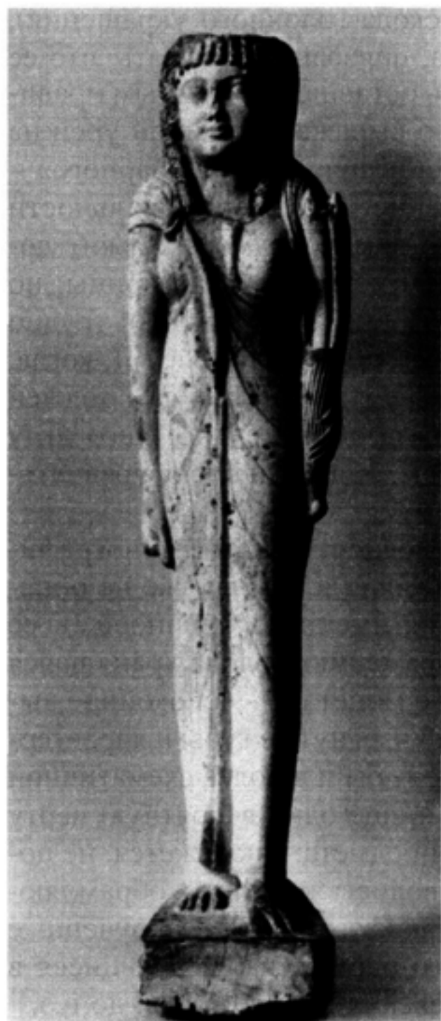
Рис. 2. Статуя обожествленной Арсиной II Филадельфы (Metropolitan Museum of Arts, N.Y. Inv. 20.2.21; приводится по изданию: Albersmeier. Das «Isisgewand» der Ptolemäerinnen: Herkunft, Form und Funktion. S. 423. Abb. 4)

статуя из Музея Метрополитен в Нью-Йорке II в. до н.э. (20.2.21) 32 (рис. 2), хотя совсем отчетливую аналогию трактовке волос на нашей подвеске мы находим, видимо, еще раньше на голове Арсиной III из художественного Музея Уолтерса (Балтимор, США 33 ; рис. 3; на этом изображении нет ниспадающих на лоб прядей, зато, как и на подвеске, имеются следы крепления надо лбом некоего атрибута). В связи с этим немаловажно, как применительно к таким памятникам скульптуры решается вопрос об их принадлежности к эллинской или египетской традиции. Во многих случаях (в частности, в случае статуи из Музея Метрополитен) их нужно отнести однозначно ко второй из них по таким критериям, как постановка ног (левая выдвинута «на шаг» вперед, при том что в остальных чертах фигура царицы статична), наличие заднего опорного столба и иероглифическая надпись на нем. В то же время пресловутые «закрученные штопором пряди», одежда с характерным узлом на груди, расположенным подчеркнуто асимметрично, ближе к правому плечу (еще одна черта эллинистической иконографии Иси-