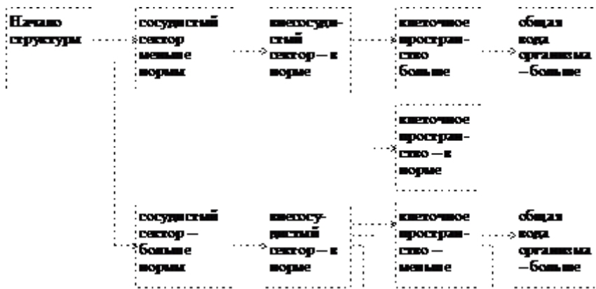
Рис. 3. Пример дерева диалога с экспертом

Гипертекстовый учебник создается с помощью специализированного ПС. В качестве ППП могут использоваться как программы расчетного характера типа калькулятора, рабочих листов MS EXCEL и тому подобного, так и графического характера типа MS-PowerPoint. Так как в качестве обучающего воздействия используется ЭС, то необходимо выполнение этапа приобретения знаний.