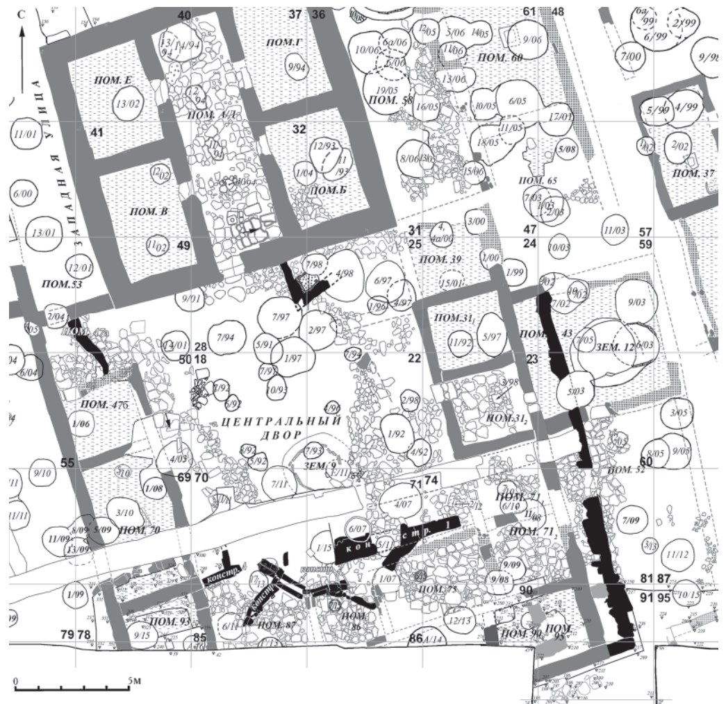
Рис. 3. Первые позднескифские конструкции в южной части Центрального строительного комплекса Кара-Тобе (выделены черным цветом).