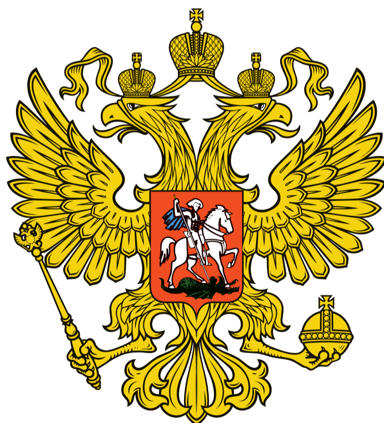
Государственный герб Российской Федерации