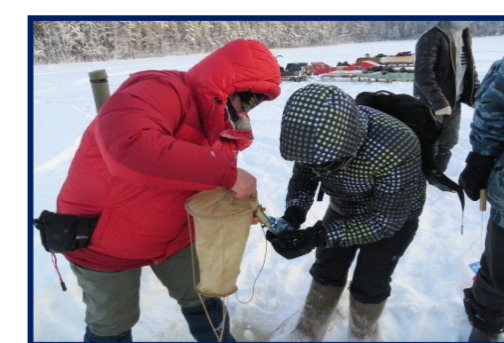
Изучение уровня режима озер