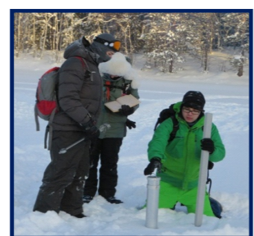
Оценка пространственно-временной изменчивости характеристик снежного покрова