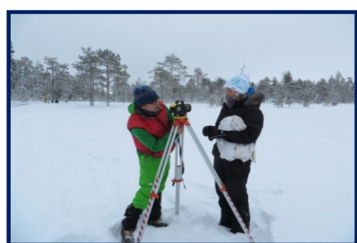
Определение высотных отметок уровней озер