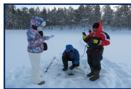
Изучение гидрологической структуры водоемов