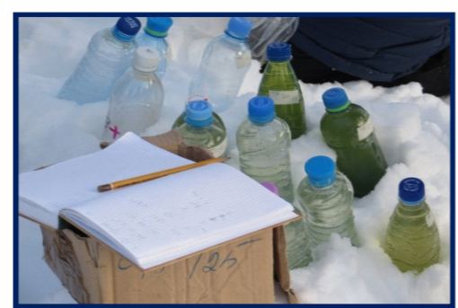
Отбор проб льда, воды на химический, спектральный анализ